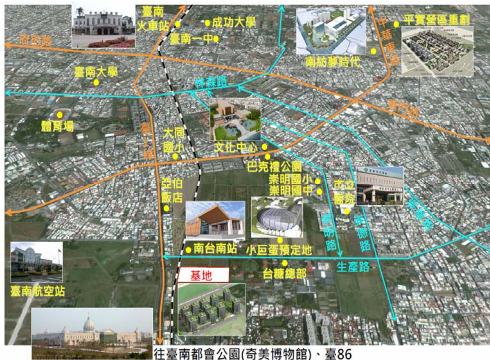
專案照顧住宅基地區位圖